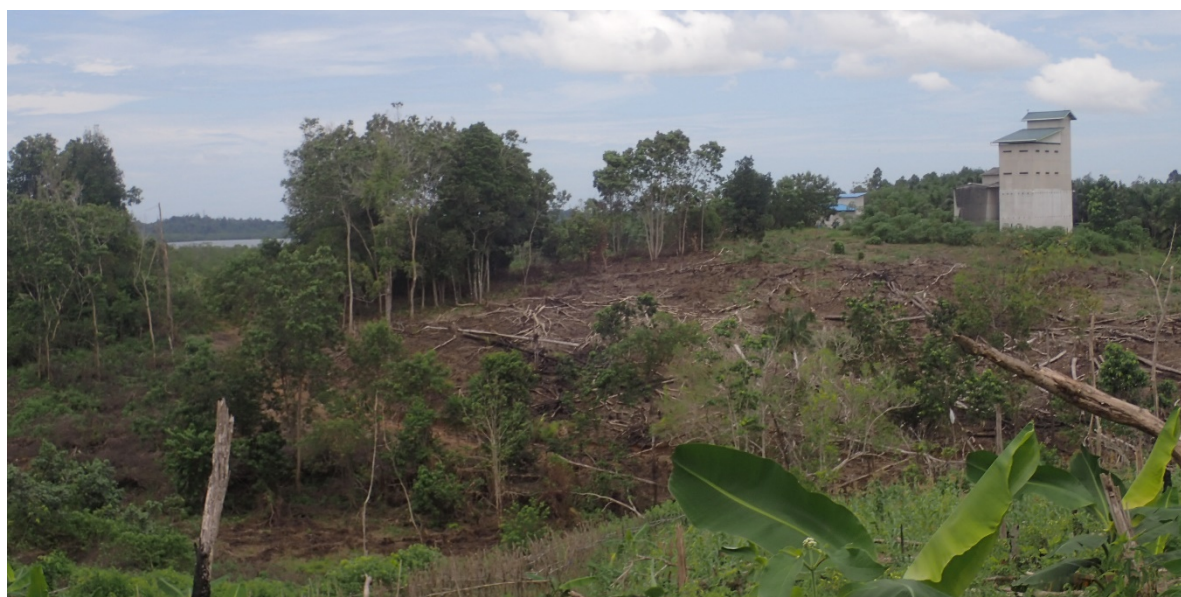
Toto vypálené pole se nachází v bezprostřední blízkosti mangrovového lesa a představovalo biotop opic kahau nosatých

Období sucha začalo letos v červnu a jeho vrchol by měl nastat v srpnu. Na Borneu prší i v období sucha, ale často s několikadenními přestávkami, které stačí k tomu, aby se vytvořily podmínky příhodné pro vznik požárů. Letošní sucho má celkem normální průběh, ve srovnání s rokem 2015, kdy naposledy došlo k jeho prodloužení v souvislosti klimatickým jevem El Niño. Drobní rolníci sucha každoročně využívají k vypalování křovin i vzrostlého lesa, aby tak obnovovali nebo rozšiřovali svá políčka. Tím však riskují nekontrolované šíření požárů na rozlehlé plochy okolního lesa. Proto je dnes vypalování lesa zakázáno a v případě porušení zákazu hrozí vysoká pokuta nebo vězení.