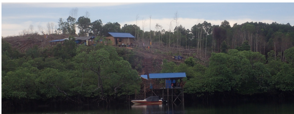
Tento gang spekulantů vybudoval dokonce i malou osadu s přístavem, aby mohl území prohlásit za vlastní

Na stejném území však dochází i k dalším znepokojivým událostem. Les na území Kariangau byl totiž před několika let zahrnut do průmyslové zóny, což značně podpořilo činnost spekulantů s pozemky. Ti les kácí a vypalují a zakládají na něm farmy a osady v naději, že si pak budou moct pozemky nárokovat a prodat je průmyslovým podnikům (které tím zároveň zbaví špinavé práce ničení ochrannářsky cenných lesů). Lesy Kariangau jsou dnes plné cedulí se jmény „majitelů“, kteří si půdu nárokují. Bohužel i v těchto případech se vláda a odpovědné nevládní organizace zdráhají jakkoli zakročit. Dva případy, které jsme oznámili v minulých týdnech, zůstávají bez jakékoli odezvy. I zde však doufáme ve zvrát v případě, že se problém podaří zviditelnit v tisku.