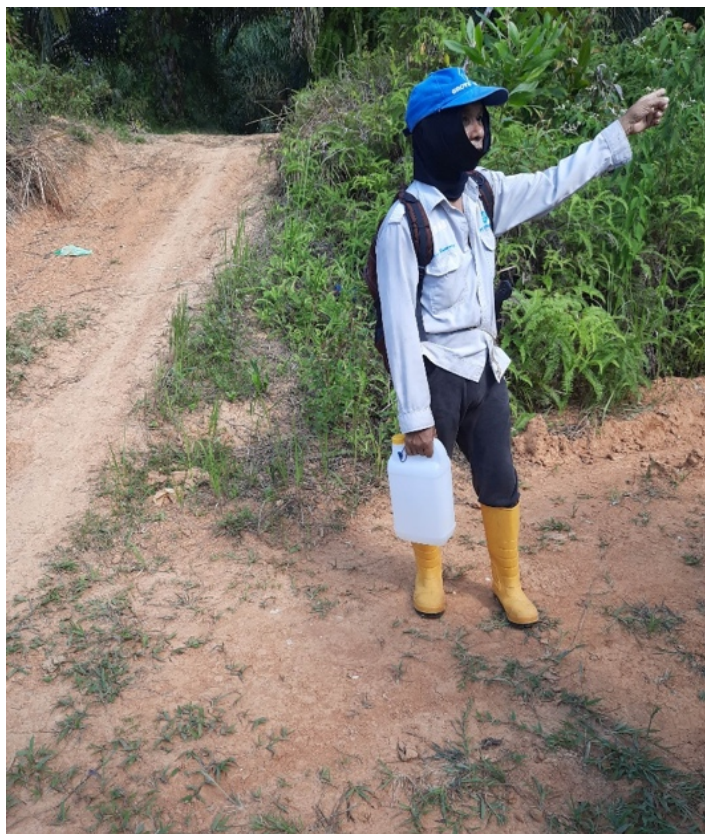
Monitoring požárů není snadný. Jde často o soukromé pozemky a majitel této farmy pávě naši hlídce zakazuje vstup na jeho území

Požáry v Balikpapanském zálivu můžeme sledovat díky dvěma různým satelitům NASA, které detekují požáry na celém světě a hlásí je se zpožděním ne více než jeden den.