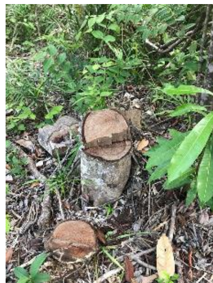
Ke kácení stromů podél rozestavěné silnice dochází sice v malém měřítku, zato ale dlouhodobě