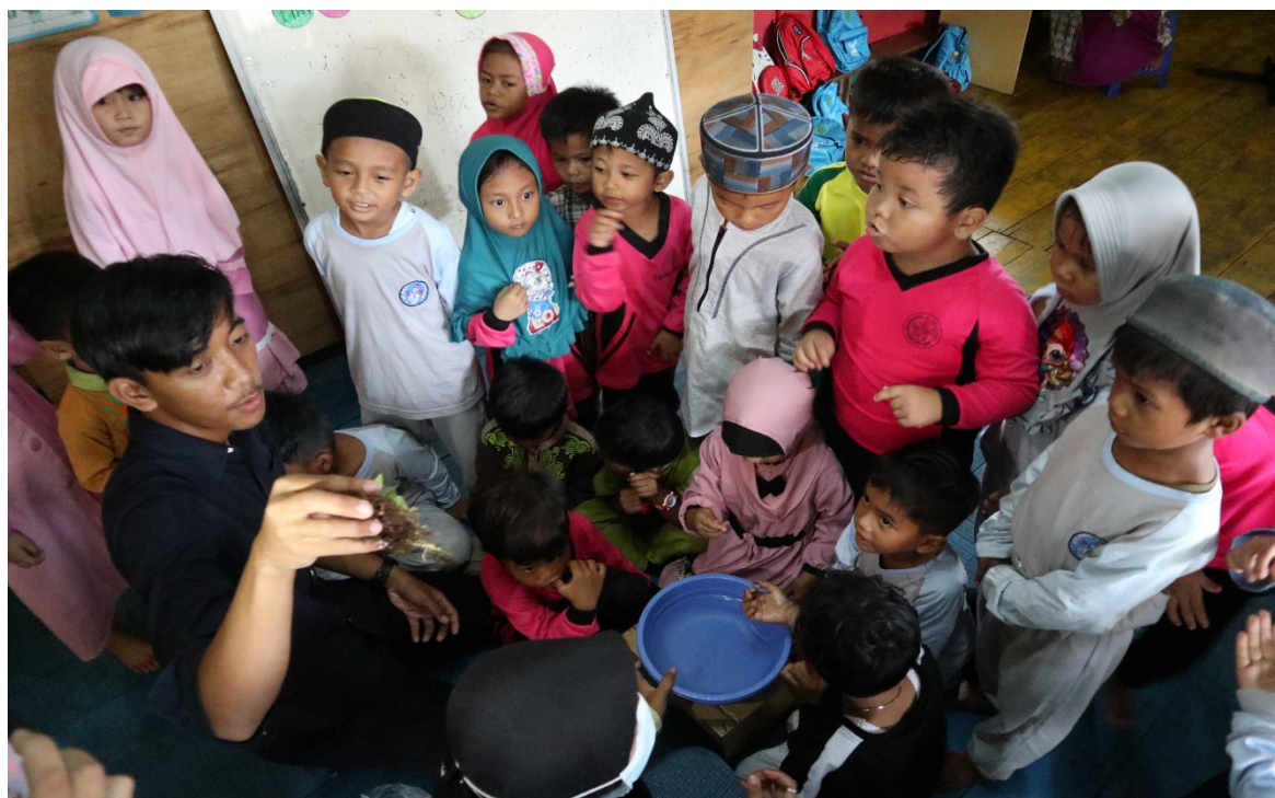
Děti zjišťují, jak různě se mohou běžné přírodniny kolem nás chovat, například když je ponoříme do vody. Třeba mech vodu nasaje a pak ji pomalu po kapkách znovu uvolňuje

Optimismus nám ale dodávají úspěchy dalších škol na Sumatře a na Jávě, které se o programu Education4Conservation zapojily. Věříme tomu, že letošní neúspěch v Jeneboře byl výsledkem nepříznivých okolností, ze kterých se naši učitelé mohou poučit pro příští školní rok, který začne v polovině července. Pokusíme se během něj pracovat s novým ročníkem dětí ve stejné mateřské školce. Než se budeme moci vrátit k výuce environmentální výchovy i na základních a středních školách, tak jak tomu bylo před pandemií, bude nejprve nutné zajistit konzistentnost a profesionalitu nového učitelův týmu, a k tomu jediný rok nemusí stačit, jak se právě ukázalo.