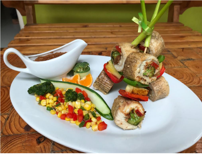
Vítězný recept letošní kuchařské soutěže, rybí saté se zeleninou

soutěže se osvědčil natolik, že jej zachováme i v příštích letech, bez ohledu na další vývoj pandemie.