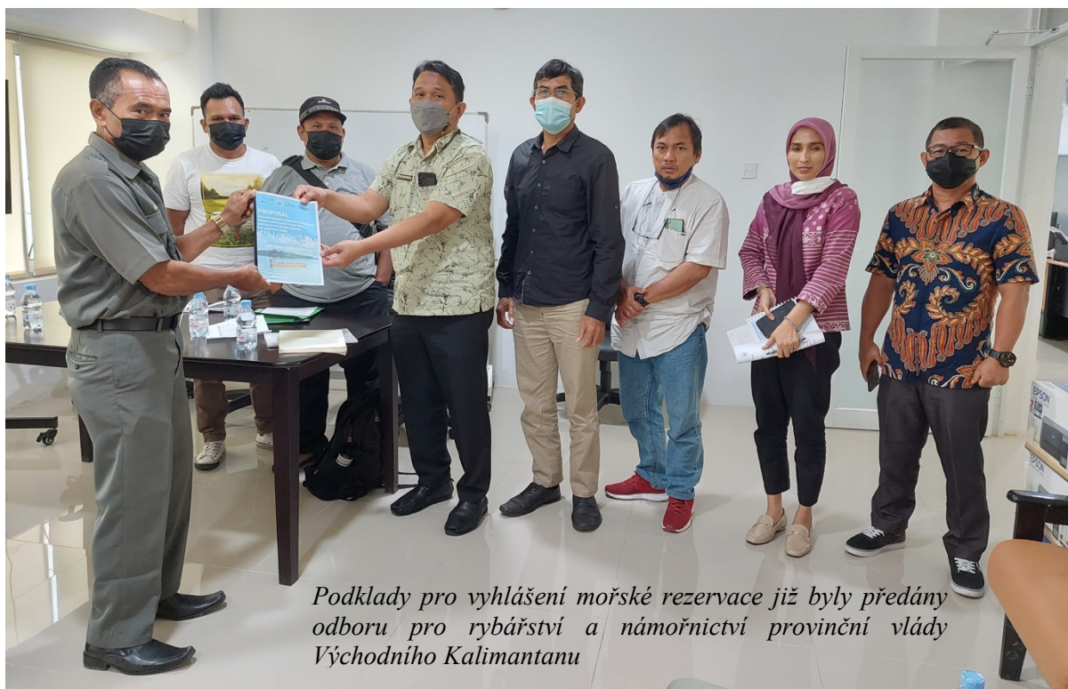
Podklady pro vyhlášení mořské rezervace již byly předány odboru pro rybářství a námořnictví provinční vlády Východního Kalimantanu

Proces vyhlášení nové mořské rezervace (pawasan konservasi perairan) pokračuje pod záštitou organizace Yayasan KEHATI v rámci programu Tropical Forest Conservation Act Kalimantan, založeném na směně mezinárodního dluhu Indonésie za rozšíření sítě